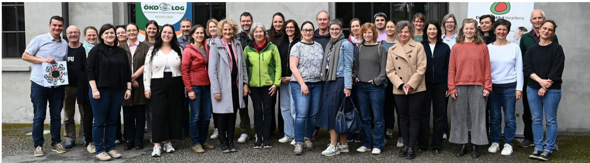
Zum ersten Mal fand ein Vernetzungstreffen dieser beiden Programme statt.