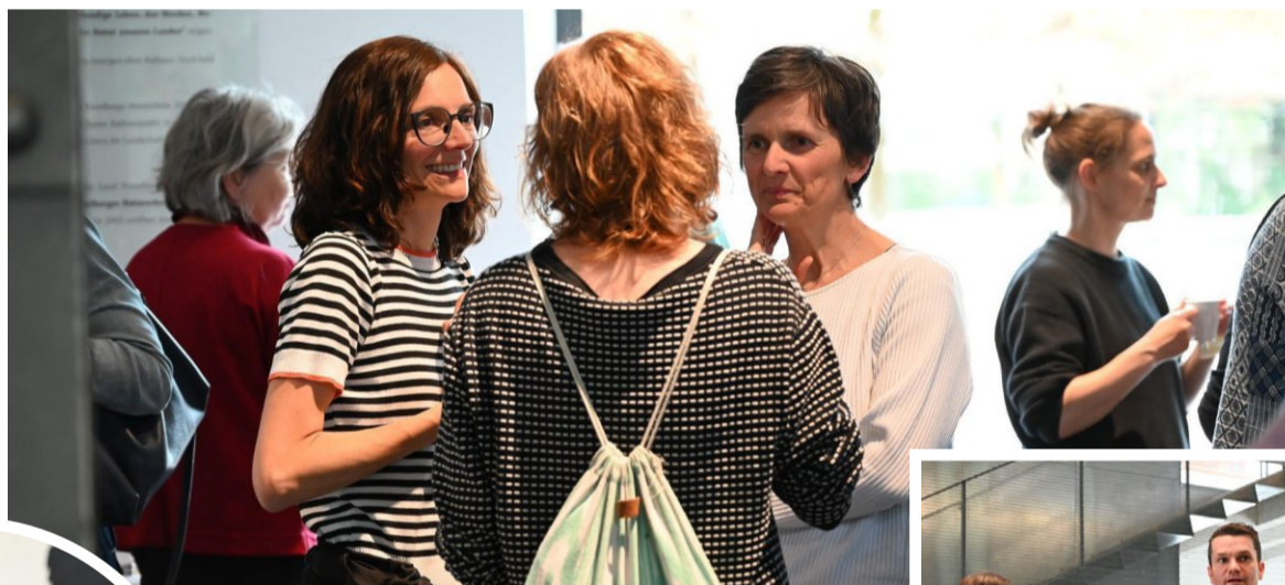
ÖKOLOG- und Umweltzeichen-Schulen vernetzten sich am Mittwochmittag in der inatura in Dornbirn.

Das österreichische Umweltzeichen wurde 2002 als Bundesinitiative ins Leben gerufen und zertifiziert Schulen sowie Pädagogische Hochschulen, die besonderes Engagement für Umwelt und Nachhaltigkeit zeigen. Mit vielfältigen Maßnahmen bringen sie Umweltschutz und nachhaltige Ent-